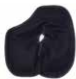
Pack de froid pour le sein droit