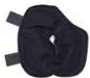
Pack de froid pour le sein gauche